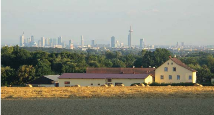
Blick über die Dickmühle nach Frankfurt