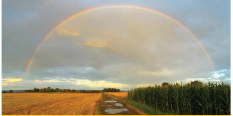
Regenbogen über dem Hühlerweg

1 2 3 4 5 6 7 8 9 10 11 12 13 14 15 16 17 18 19 20 21 22 23 24 25 26 27 28 29 30 31