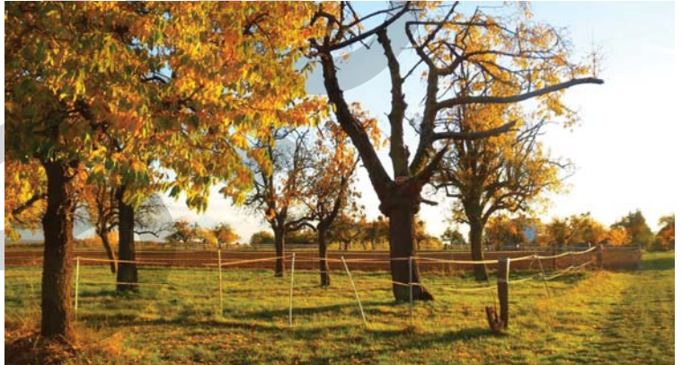
Schneise mit Blick in Richtung Satepfad

1 2 3 4 5 6 7 8 9 10 11 12 13 14 15 16 17 18 19 20 21 22 23 24 25 26 27 28 29 30