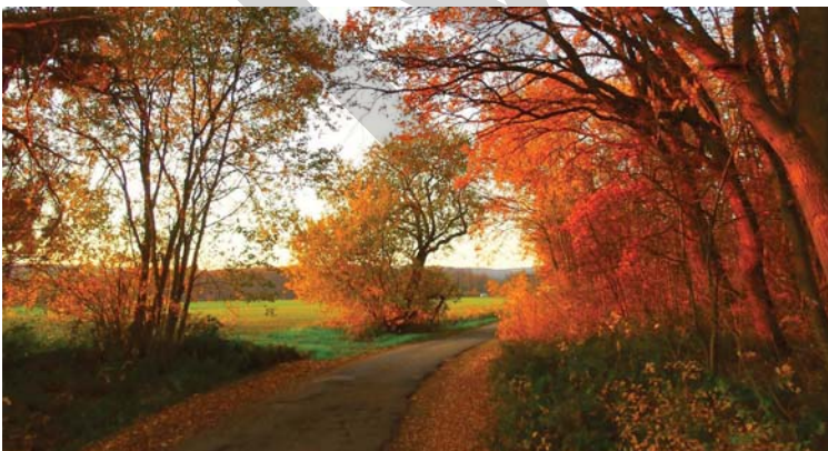
Am Ausgang des Vogelschälchens

1 2 3 4 5 6 7 8 9 10 11 12 13 14 15 16 17 18 19 20 21 22 23 24 25 26 27 28 29 30 31