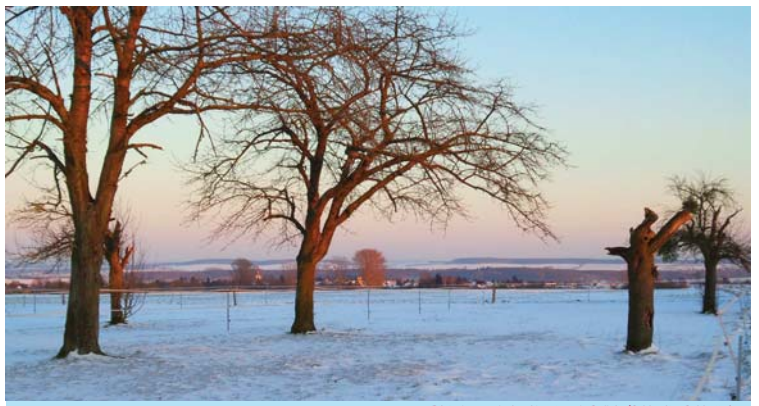
Blick über vereisnete Koppeln nach Poßheim

1 2 3 4 5 6 7 8 9 10 11 12 13 14 15 16 17 18 19 20 21 22 23 24 25 26 27 28 29 30