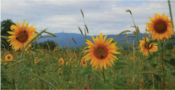
Sonnenblumen vor Feldbergkuppe

1 2 3 4 5 6 7 8 9 10 11 12 13 14 15 16 17 18 19 20 21 22 23 24 25 26 27 28 29 30 31